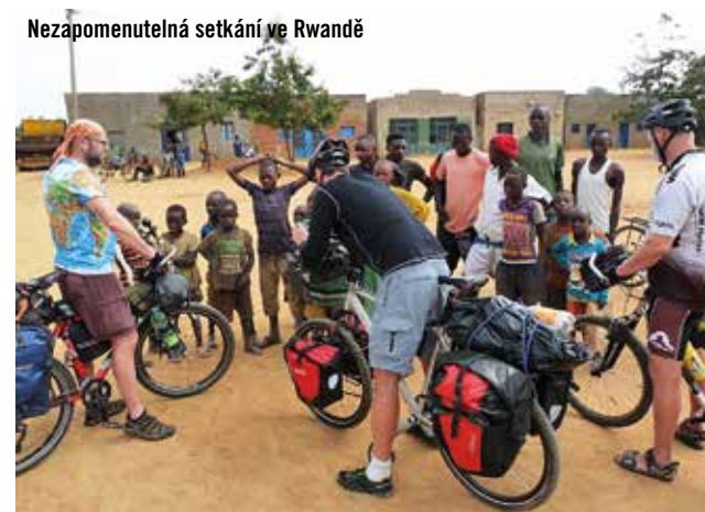
Nezapomenutelná setkání ve Rwandě