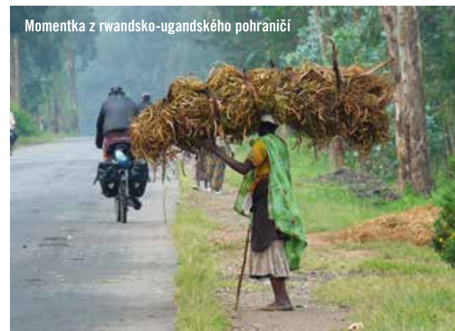
Momentka z rwandsko-ugandského pohraničí