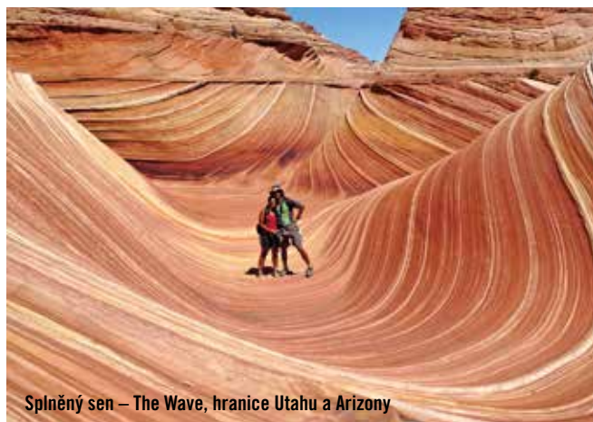
Splněný sen – The Wave, hranice Utahu a Arizony