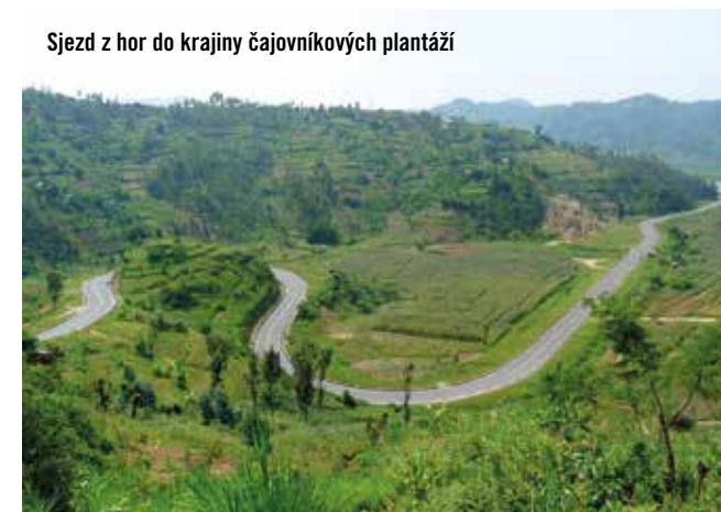
Sjezd z hor do krajiny čajovníkových plantáží