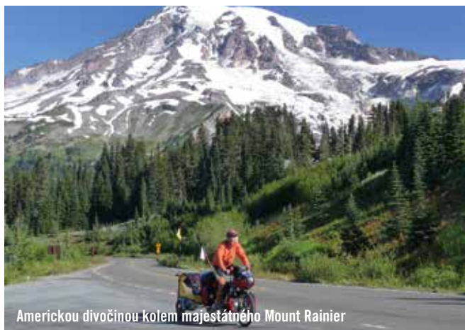
Americkou divočinou kolem majestátného Mount Rainier