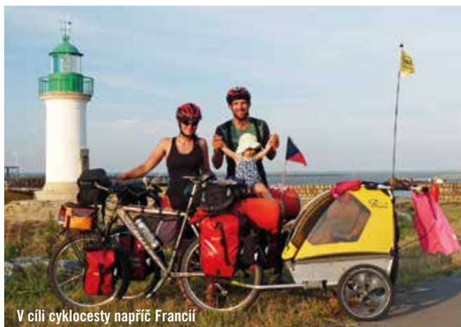
V cíli cyklocesty napříč Francií