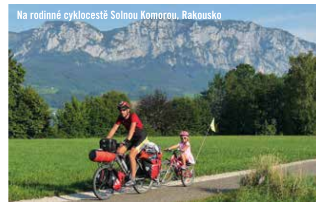
Na rodinné cyklocestě Solnou Komorou, Rakousko

Nápad vznikl někdy kolem roku 2004 až 2005 a v roce 2006 už jsme uskutečnili první jednodenní festival ve Frýdku-Místku. O rok později jsme se rozšířili do Hradce Králové a pak i do Brna. Z jednodenních festivalů následně někde vznikly i třídení atd. Na to pak navázaly ještě pravidelné cestovatelské promítačky na Prašivé a další různé akce jako Cyklovíkendy pro rodiny s dětmi nebo projekt Kočárky na vrcholy. Vývoj byl postupný, člověk nesmí ustrnout.