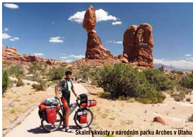
Skalní skvosty v národním parku Arches v Utahu