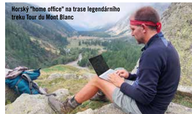
Horský "home office" na trase legendárního treku Tour du Mont Blanc