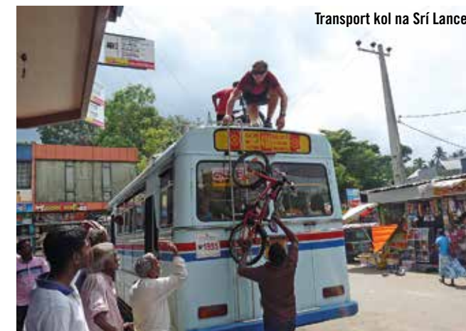
Transport kol na Srí Lance